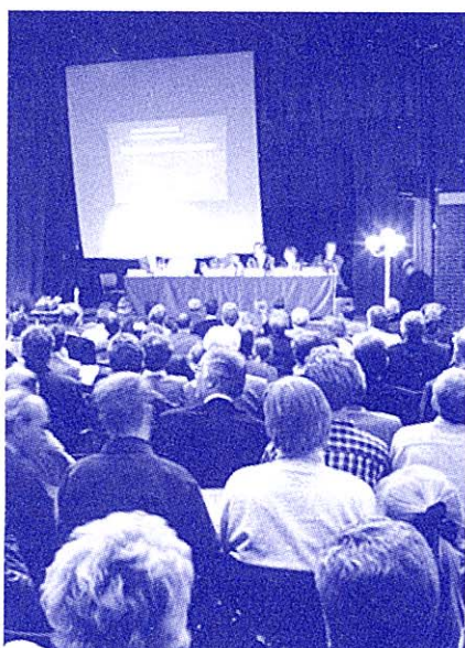
Informatie door de RDR in de Veluwe Hal te Barneveld. 10.000 steringen bij 100.000 gezinnen verwacht.

werd over het inventariseren van storingsgevoelige apparatuur, het oplossen van storingen, bewijslast en schaderegelingen was erg ongeloofwaardig. Er was absoluut geen beeld van mogelijke economische schade. En dan te bedenken dat de zender later een groot deel van Europa wilde gaan bestrijken, en ook Apeldoorn dus in de stralingsbundel zou komen te liggen!"