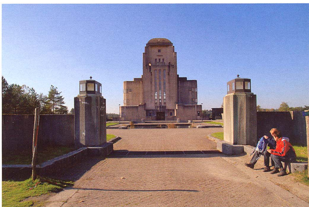
Tekst: Maarten Mandos, foto: Ries van Wendel de loode / Hollandse Hoogte

Op de hei rijst het gebouw van Radio Kootwijk als een sfinx op uit het landschap.