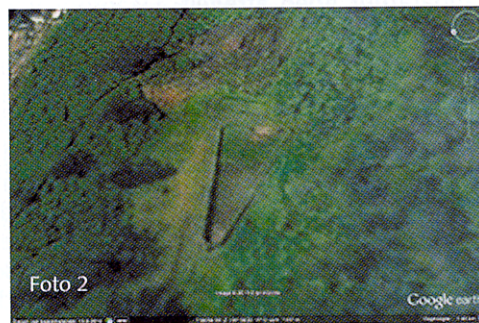
foto 2 is een Google earth opname van de huidige resten.

Foto 1 is een foto van een foto uit een boek en laat het gebouw zien met links onder het koelwaterbassin,