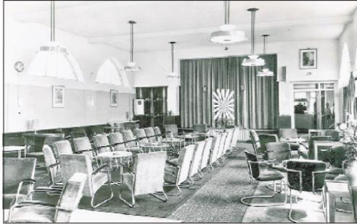
De recreatiezaal van het hotel met de fraaie Gispens-stoelen.

De meningen over het landschap rond Zendgebouw A van het dorpje Radio Kootwijk zijn verdeeld. De één is dolenthousiast over de weidsheid en de rust die het uitstraalt en de ander vindt het maar een dooie boel. Om daar nu een lang weekend, laat staan een paar weken in een hotel te gaan zitten? Toch kon dat vroeger en misschien straks ook weer.