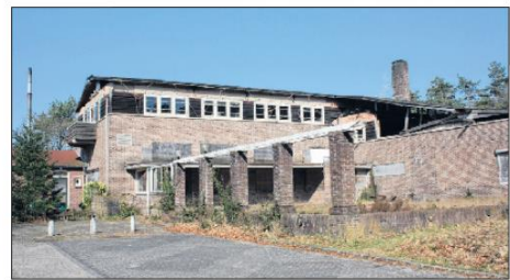
Het voormalige complex van Hotel Kootwijk Radio maakt nu een troosteloze indruk.