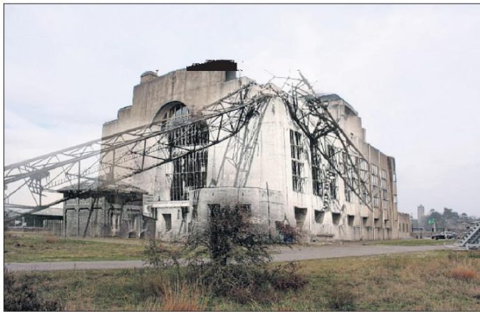
De Duitsers konden het in april 1945 niet laten de zendinstallaties te vernielen. De fotomontage is gemaakt door Berdien Brons voor de tentoonstelling 'De oorlog dichterbij' in Museum Natrac in Barneveld.

Op 26 februari 1938 werd in het hotel op feestelijke wijze herdacht dat tien jaar eerder de radiotelefoondienst Amsterdam-Bandoeng voor het publiek geopend werd. Aan de festiviteiten werd onder andere deelgenomen door prof. Koomans, grondlegger van de draadloze telefonie, hoofdgeni-