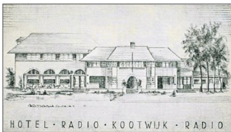
Zo zag hotel Radio Kootwijk er uit op de oorspronkelijke ontwerptekening.