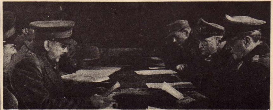
Generaal Foulkes, bevelhebber van het 1e Canadeesche corps leest de capitulatie-voorwaarden voor aan Generaloberst Johannes Blaskowitz, bevelhebber van het 25ste Duitse leger. Opgewekt zien de Duitsers er niet uit. . . .

Deze en dergelijke voorwaarden werden grif geaccepteerd. Het Herrenvolk had er genoeg van—gansch Nederland was vrij.