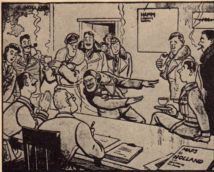
Voedsel door de lucht — "En toen dook ik tot 100 meter, en toen liet ik tweeduizend brooden pardoes op het doel vallen!" ( Sunday Dispatch ).