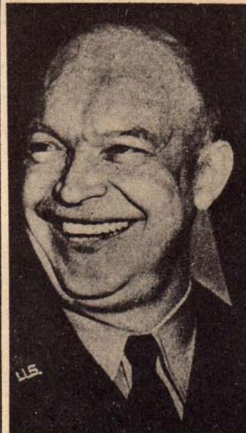
De overwinnaar! — Generaal Dwight D. Eisenhower heeft zich in dezen oorlog een strateeg getoond van groot formaat. Hij heeft zich vooral groote verdiensten verworven door de wijze waarop hij het team van briljante generaals dat onder hem werkte, bijeen wist te houden en te inspireeren