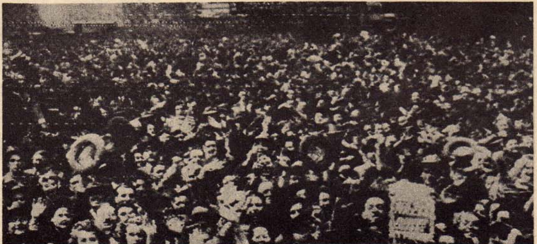
Ook in New York werd uitbundig gedemonstreerd toen het groote nieuws doorkwam. Een menigte van een miljoen personen verdrong zich op Times-Square, in het hart van de metropolis