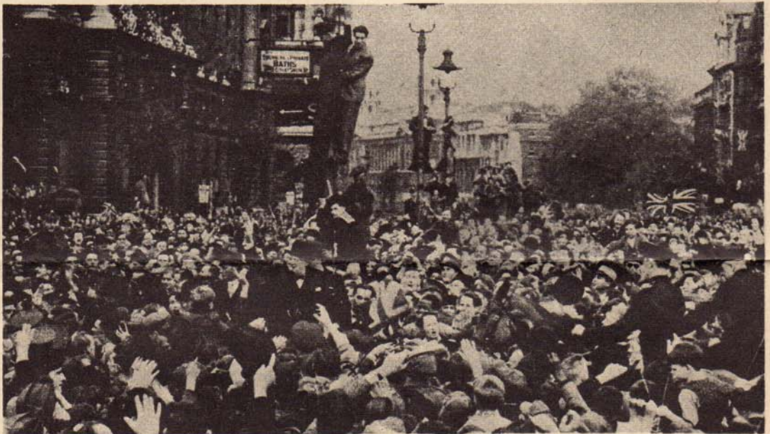
Churchill verlaat no. 10 Downing Street teneinde het nieuws van Duitslands capitulatie bekend te maken aan het Lagerhuis. Tientuizenden Londenars omstuwen hem—maar hij heeft geen gewapende lijfwacht noodig!