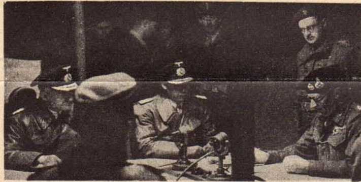
Boven: Het gedenkwaardig tooneel in een tent op de Lüneburger Heide. Het is ver van Alamein, maar de overwinnaar is dezelfde: Monty! — Rechts: Een historisch document.

De geheele plechtigheid heeft vijf minuten geduurd. Een miljoen Duitsers hebben zich onvoorwaardelijk overgegeven.