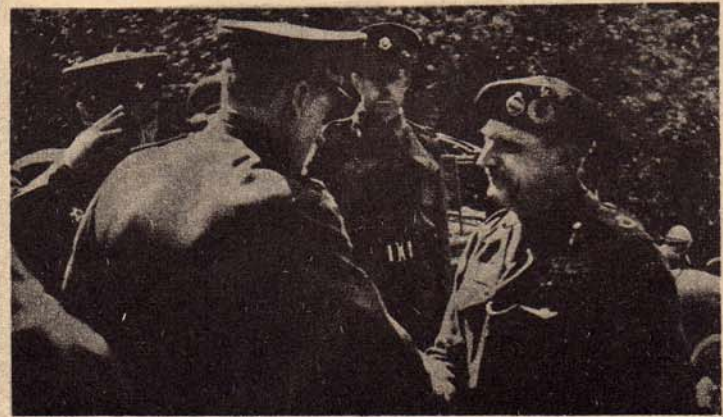
Oost en West ontmoeten elkaar. Maarschalk Rokossowski schudt veldmaarschalk Montgomery hartelijk de hand, ergens aan de Elbe, in het hart van Duitschland. Het einddoel is bereikt.