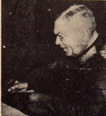
Keitel, chef van het Oberkommando der Wehrmacht gedurende dezen Wereldoorlog, ondertekent te Berlijn Duitslands onvoorwaardelijke overgave

In een eenvoudig klaslokaal van een Fransche ambachtsschool in de buurt van Rheims heeft Duitsland zich onvoorwaardelijk overgegeven. Tegen een achtergrond van het verlichte stafkaarten zaten vijftien mannen rond een oude gesleten tafel, die de sporen droeg van honderden scholieren, die er met hun messen in hadden zitten kerven. Voor de fotografen en filmoperateurs was een speciale verlichting geïnstalleerd, die de gezichten der deelnemenden scherp afteekende. Aan den muur een kalender met den datum: 7 Mei 1945.