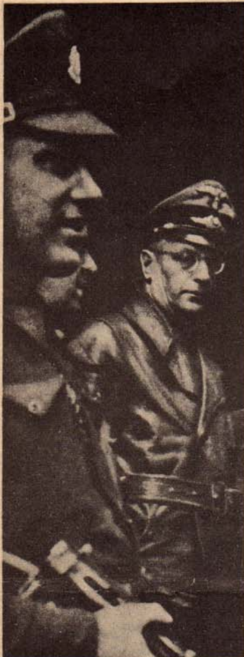
Seys-Inquart wordt opgebracht. Hij werd gearresteerd in Noordwest-Duitschland, en terstond naar Nederland overgebracht, waar hij in Mei 1940 de belofte uitsprak, "nimmer het Nederlandsche volk het nationaal-socialisme op te zullen dringen."