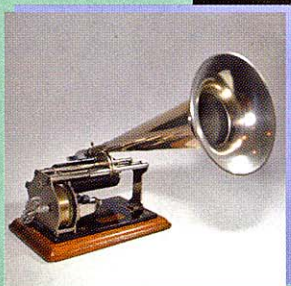
Grammofoon- museum Nieuwleusen