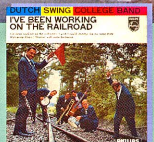
Dutch Swing College Band Herinneringen