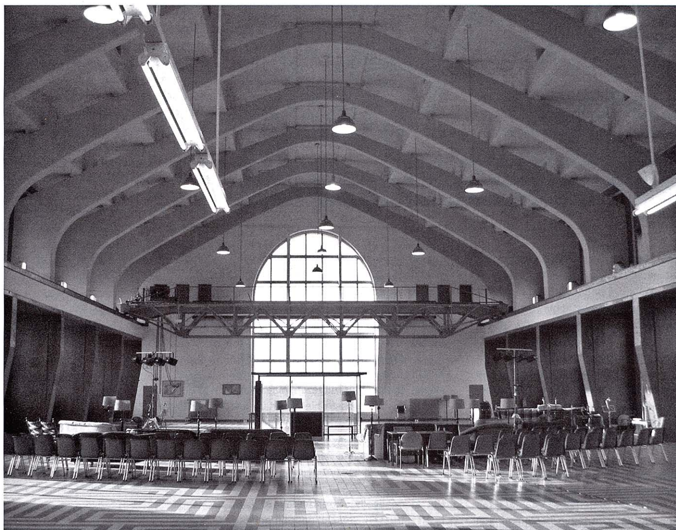
De imposante zendhal, tijdelijk ingericht voor de uitvoering van een opera.

Nog even terug in de historie. Met de bouw van het zendstation begon de PTT ook met de werving van personeel dat dag en nacht bereikbaar moest zijn. Rond het zendstation groeide een 'dorpskern': vier blokken van zes dienst-